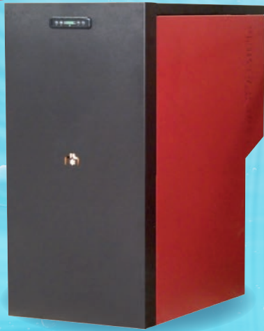
BERING - 12 kW