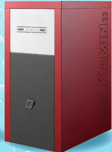
OTTAWA - 24 kW