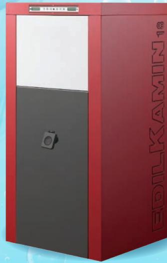
BASIC - 18 kW